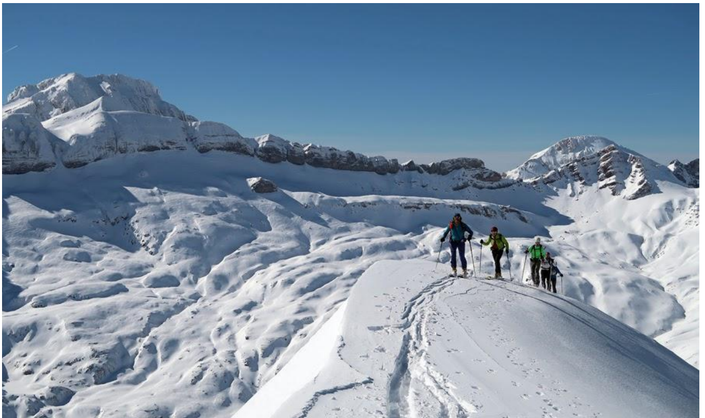
Imagen de la pagina la meteo que viene.

Beharrezko materiala-Material obligatorio: Goi mendiko arropa eta oinetakoak-Ropa y calzado de montaña. Pioleta, kaskoa, kranpoiak-Piolet, casco, crampones